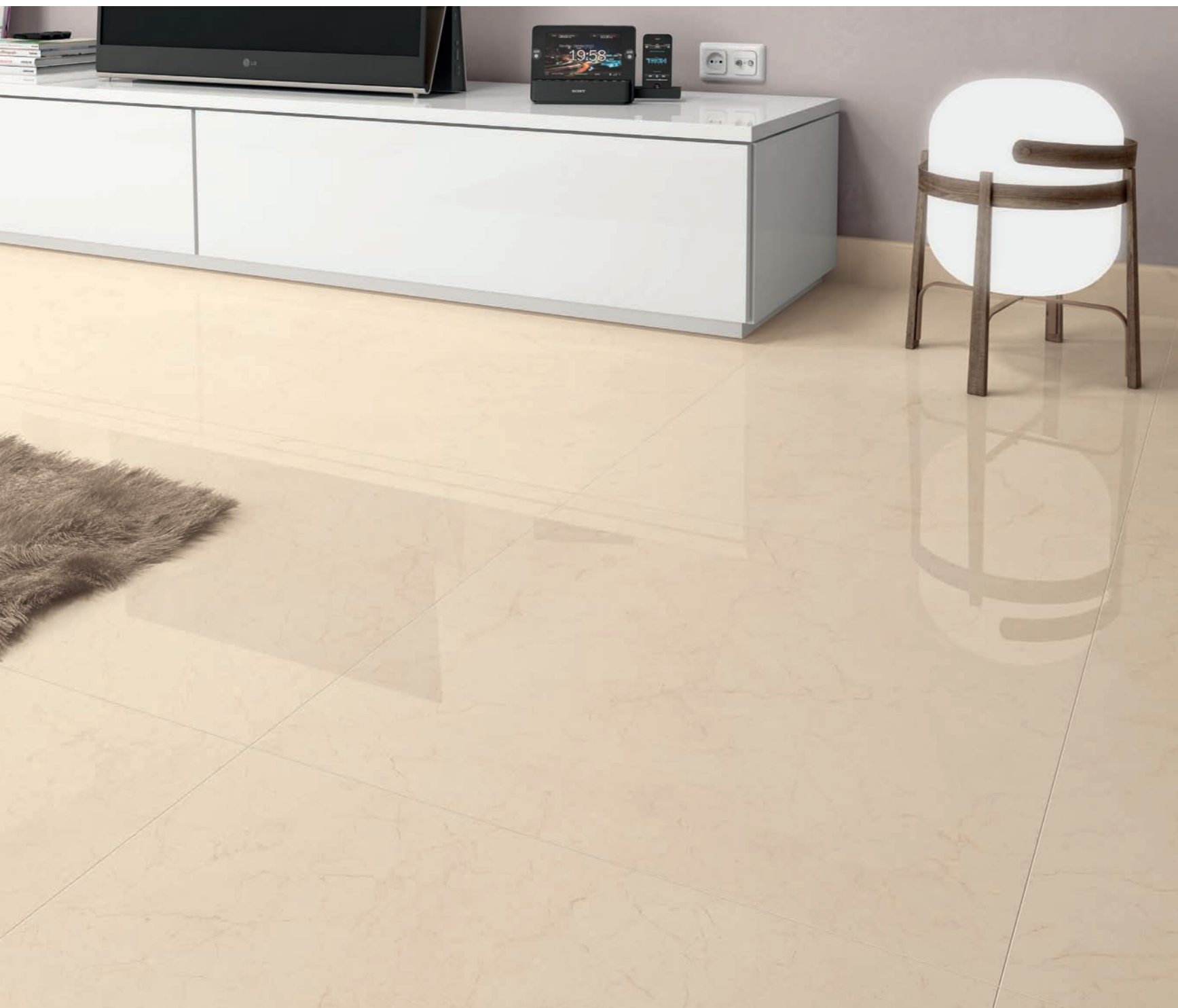
Pvto. / Floor / Sol: At. Cremar Crema 60,8x60,8