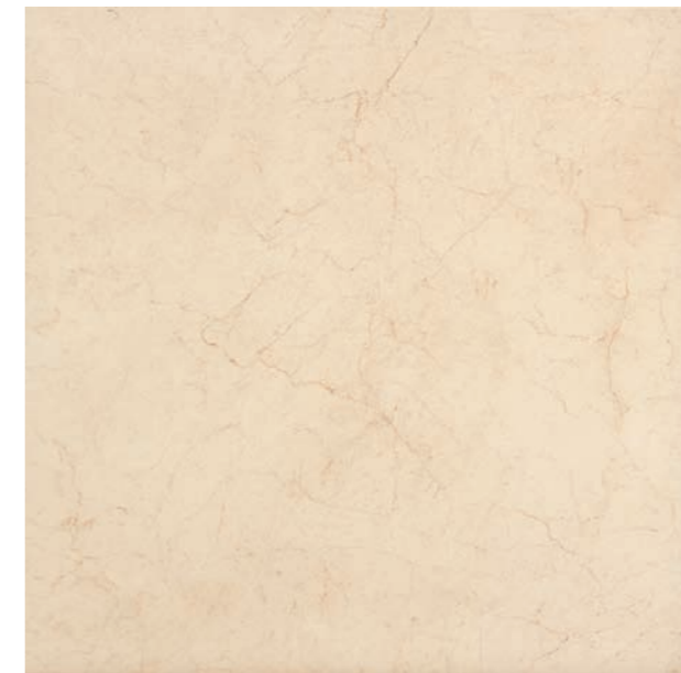
●At.Cremar Crema 60,8x60,8 M08 15.460.096.0785 PEI 4

GRES PORCELÁNICO ESMALTADO GLAZED PORCELAIN TILES GRÈS CÉRAME ÉMAILLÉ