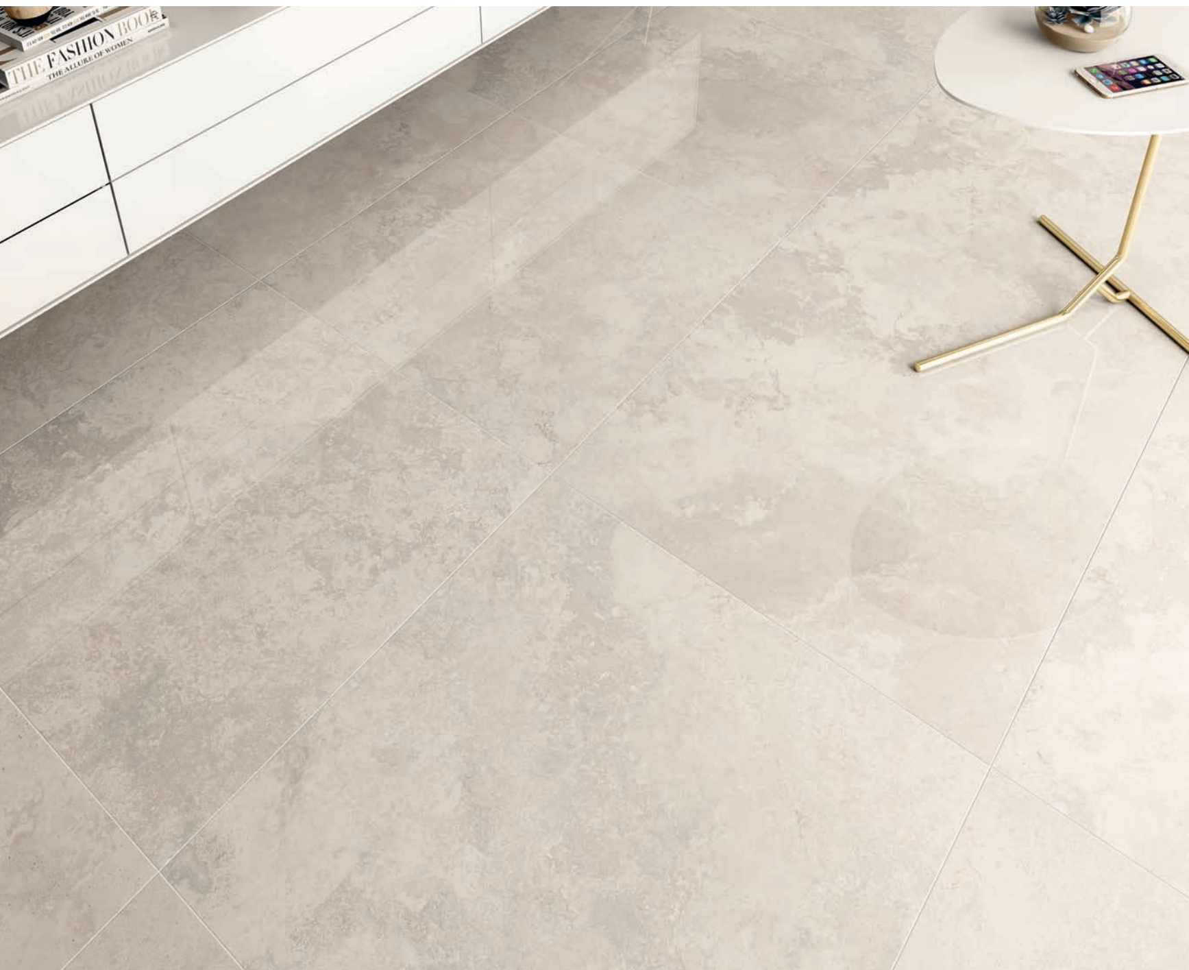
Pvto. / Floor / Sol: At. Ollan Nácar 60,8x60,8