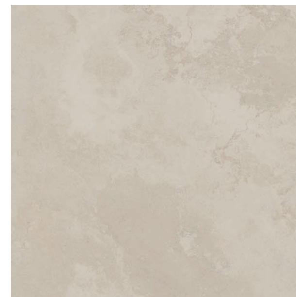
●At.Ollan Nácar 60,8x60,8 M08 15.460.030.9062 PEI 4

GRES PORCELÁNICO ESMALTADO GLAZED PORCELAIN TILES GRÈS CÉRAMÉ ÉMAILLÉ