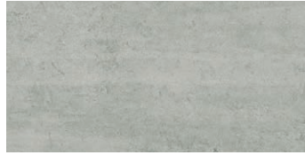
At. Marte Gris PEI 4