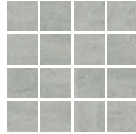
Malla At. Marte 30x30(7)