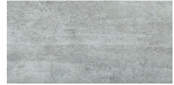
At. Marte Grafito PEI 3