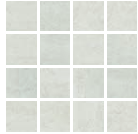
Malla At. Marte 30x30(7)